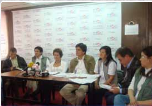
Rueda de prensa - Elección Presidencial