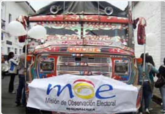
MOE Chiva - Cauca