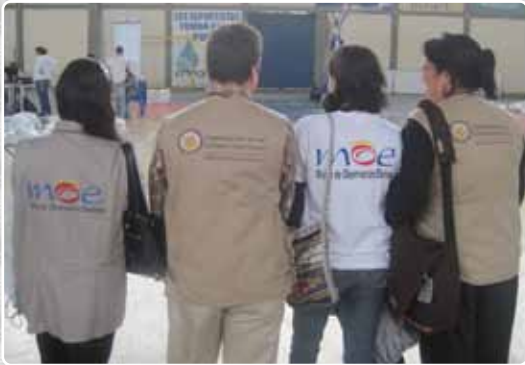
MOE y Observación internacional OEA - Nariño