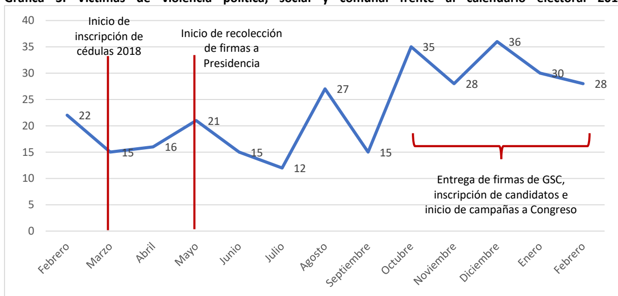
Gráfica 3. Víctimas de violencia política, social y comunal frente al calendario electoral 2017-2018

Fuente: Observatorio de Violencia Política y Social-MOE