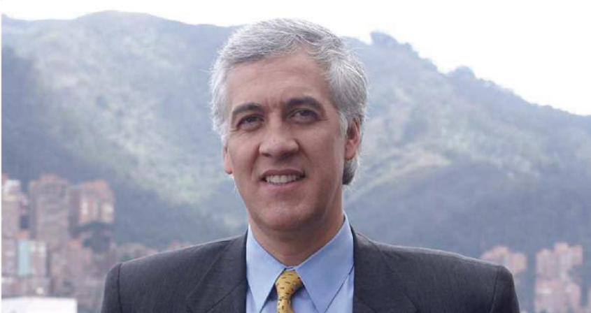
Samuel Moreno Rojas Condenado por Carrusel de la Contratación

La votación positiva a esta pregunta conllevaría a la institución de una inhabilidad de contratar con el Estado de por vida, diferente a lo ya establecido por las normas de contratación pública, que establecen un máximo de 20 años de prohibición.