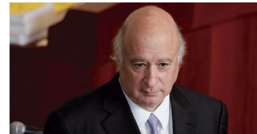
Sabas Pretelt de la Vega Condenado por Yidispolítica.