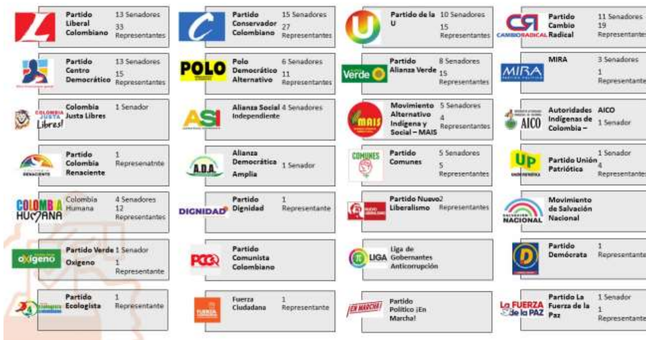
Gráfica 4. Partidos Políticos con personería jurídica reconocida por el CNE a enero de 2022.