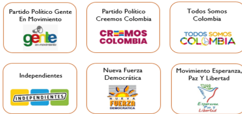
Figura No. 2. Partidos políticos con personería jurídica reconocida en el transcurso del segundo periodo de la Legislatura 2022 - 2023

Elaboración: MOE. Fuente: Consejo Nacional Electoral